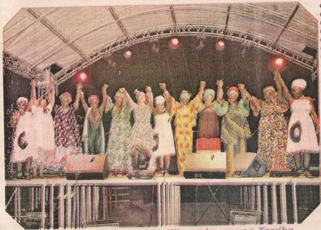
Salut final du group Fan Kika et le groupe Tériba